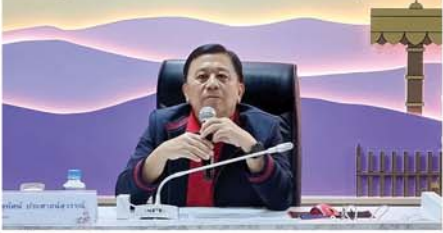
สหกรณ์ออมทรัพย์ครูเชียงใหม่ จำกัด Chiang Mai Teacher's Thrift & Credit Cooperative Lt